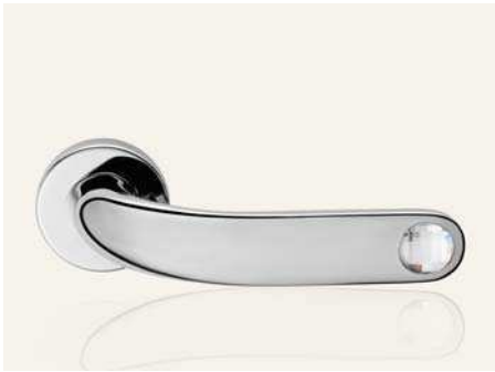
CR cromo lucido polished chrome