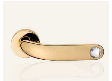
OZ oro zecchino gold plated