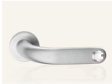
CS cromo satinato satin chrome