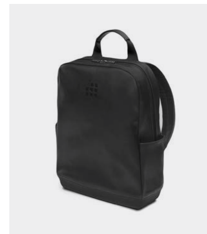
Classic Collection, Moleskine (2017)