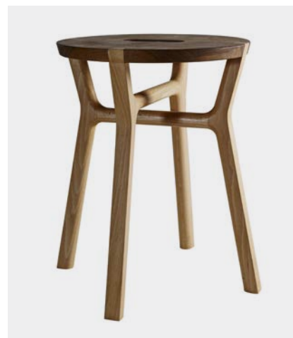
Affi, Internoitaliano (2012)