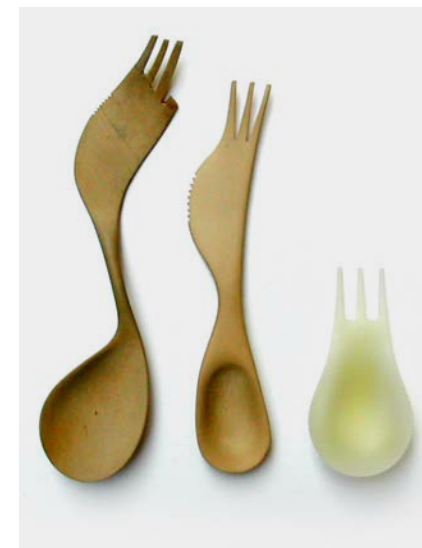
Moscardino, Pandora Design (2000)