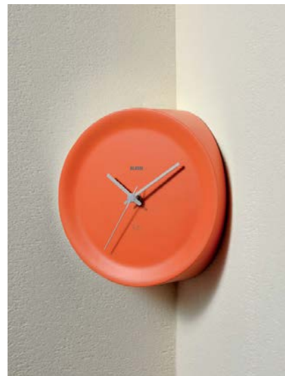
Ora In/Ora Out, Alessi (2015)